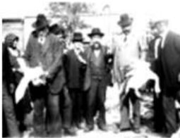
Libavásár a makói (Csanád megye) piacon a két világháború között