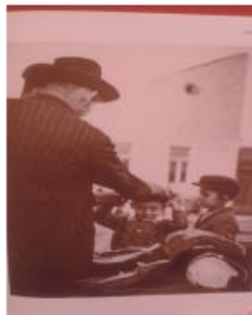
Gyerekek sapkát próbálnak a munkácsi piacon egy ortodox zsidó árusánál

A következő a kereskedés. Ez speciálisan zsidó tevékenység volt. Itt látnak mezőgazdasági termékeket áruló haszidokat, aztán fakereskedőt. Amit itt látnak, ezen vitakoztunk aztán évekig, hogy az a zsidó, aki vesz, vagy aki árul. Mit gondolnak? Ugye az a kérdés, hogy mi van a kezében? Az kés, és akkor a halat vágja, vagy pedig pénztárca. Ezen nem tudtunk megegyezni, úgyhogy nyitva hagytuk ezt a kérdést. A másik pedig egy sapkaárus, szintén haszid zsidók.