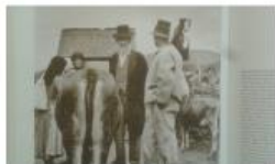
Alku a huszti (Máramaros megye) marhavásáron 1938-ban