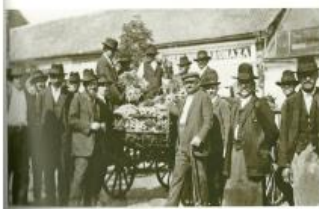
Hagymaalkuszok és -termelők a makói (Csanád megye) vásáron 1926 körül