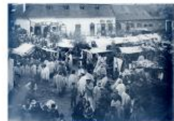
Zsidó kereskedők cégtáblái a nagybányai vásártéren

A következő piacoknak és vásároknak a története, ahol a zsidók is főszereplők voltak, és higgyék el, hogy a '30-as, '40-es években a cigányok is. Rengeteg sztorit lehetett hallani például arról, hogy ha mondjuk, van egy zsidó kereskedő, amelyik felhossa az árut a Dunán