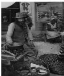
Mezőgazdasági terményeket áruló kárpátaljai ortodox zsidó az 1930-as években

Ilyen kép egyébként elég sok van. A Néprajzi Múzeumtól kaptuk ezeket a képeket egy kiállításra, amit mi szerveztünk, akkor még csak rabbiképzős oktatóként. Pont erről szólt, hogy eltűnt világaink, amikor próbáltuk ezeket a mindennapokat megmutatni.