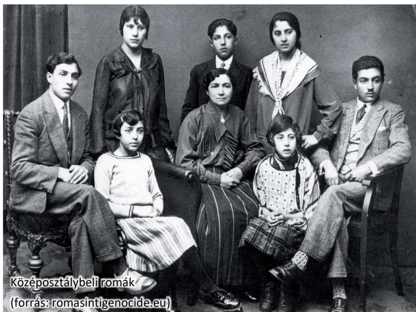
Középosztálybeli romák