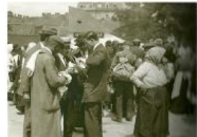
Adás-vevés a pesti Teleki téri piacon az 1910-es években