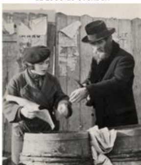
Chászid zsidó heringet vesz a munkácsi utcán (Bereg megye) az 1930-as években